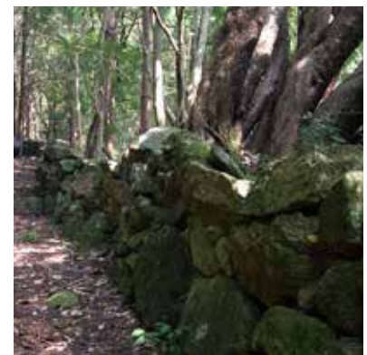
石積みみのシシ垣