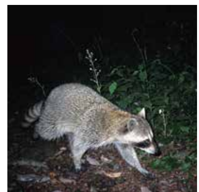
外来種のアライグマ