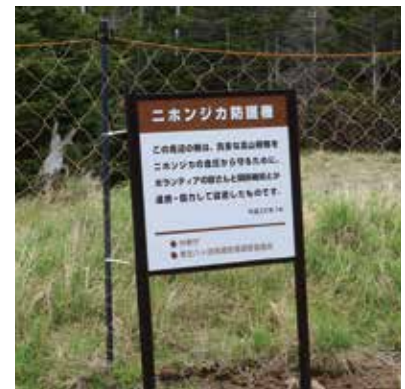
山地での植生保護柵